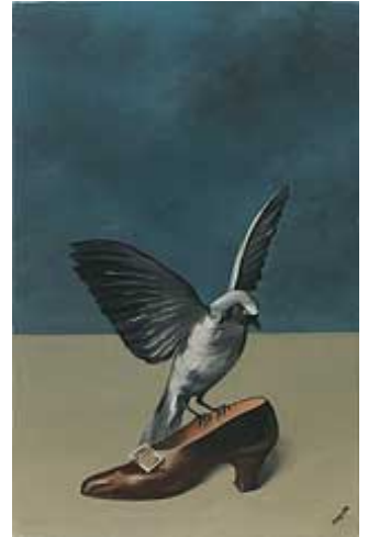
Dieu n'est pas un saint, 1935-1936

2/ Créez une nouvelle image en mêlant deux éléments existants apparentés ou non